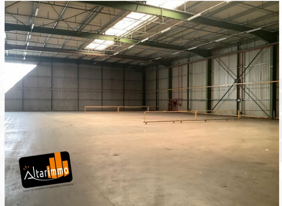
Entrepot de stockage