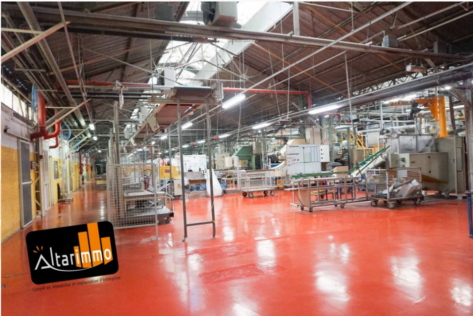
Atelier de production