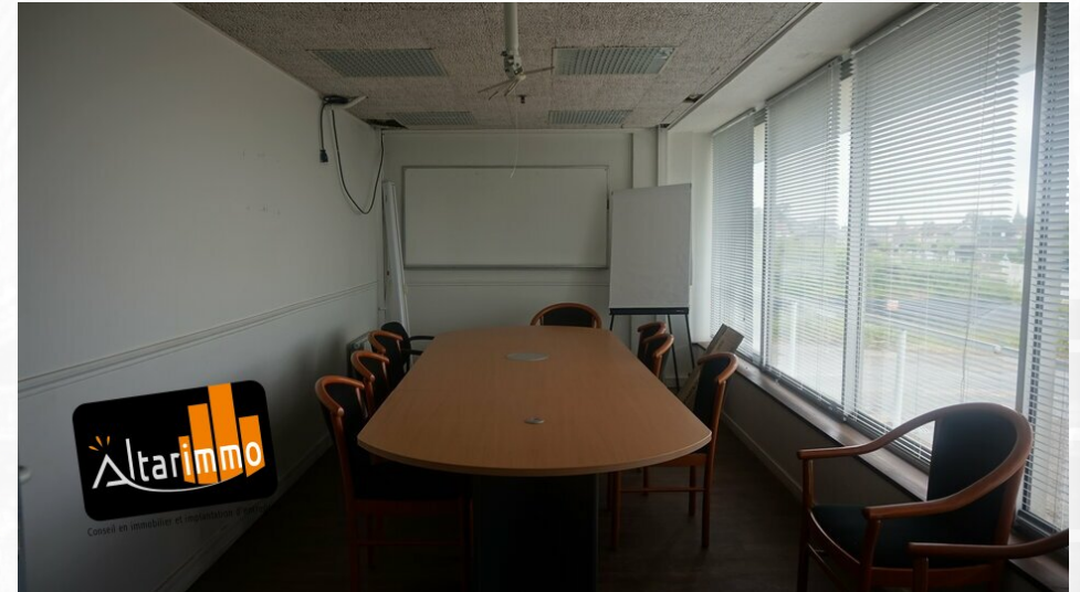
salle de réunion