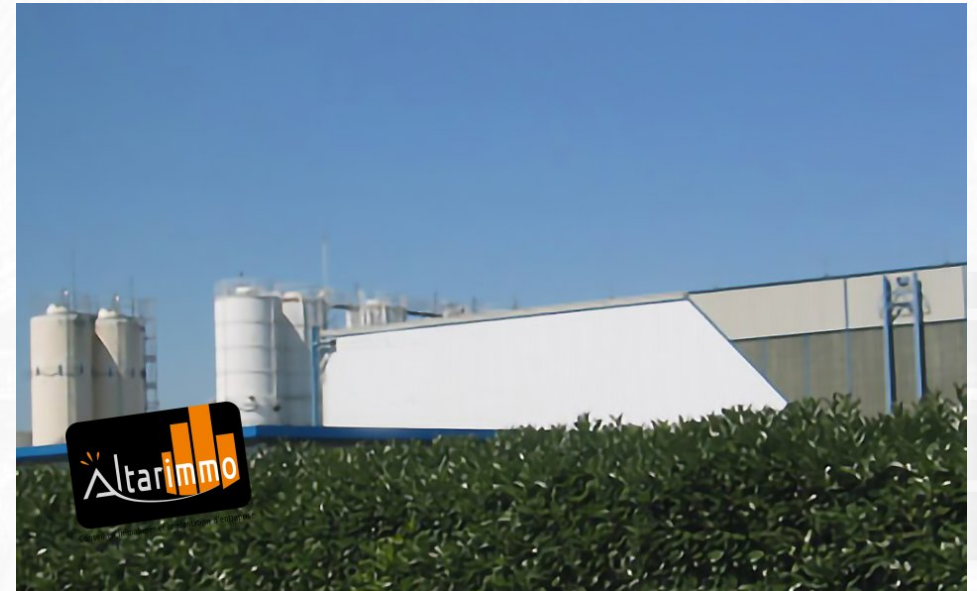
Vue d'ensemble entrepot