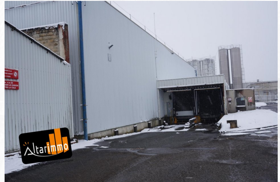
Quais niveleurs donnant sur l'entrepot de stockage